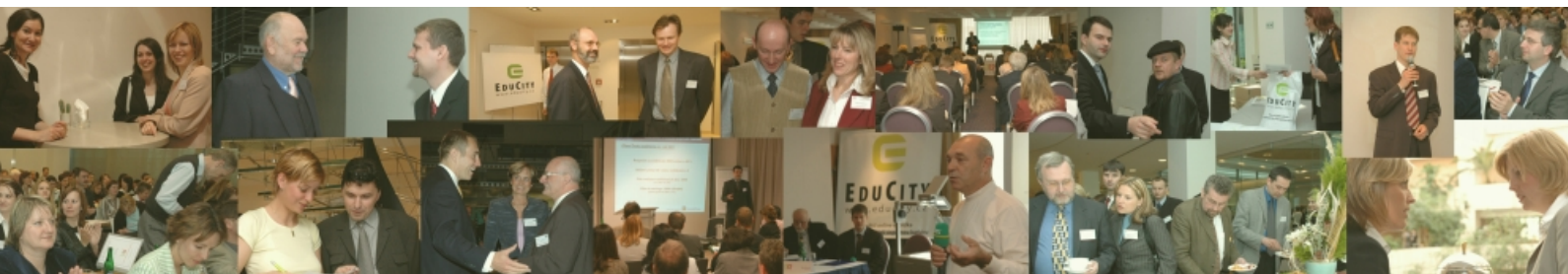
Ukázky z akcí EduCity a HR živě

Do 31. května 2009 poskytlo EduCity své kontaktní údaje 18 183 aktivních registrovaných uživatelů, z nichž 12 723 souhlasilo v souladu se zákonem o ochraně osobních údajů se zasláním dalších informací.